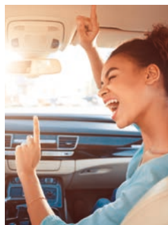
ΕΞΩΤΕΡΙΚΗ / ΕΣΩΤΕΡΙΚΗ ΘΕΑ